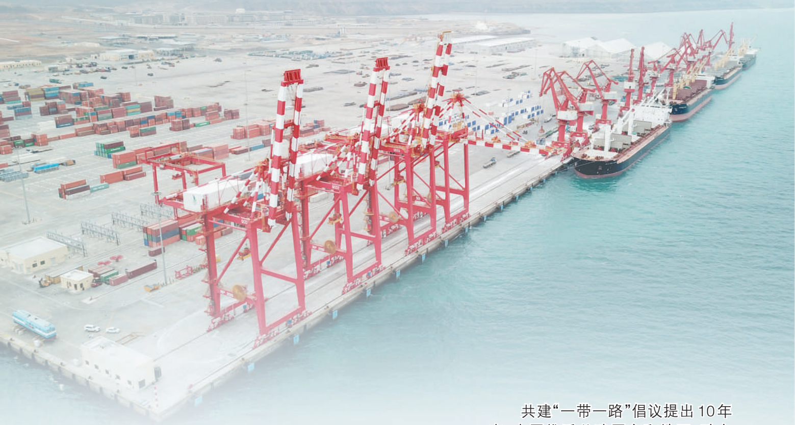
上图：吉布提多哈雷多功能港口(一期)工程由中国土木工程集团有限公司与中国建筑集团有限公司组成的联营体共同实施。该项目的建成开港，充分发挥了吉布提独特地理优势，进一步助推当地经济社会发展。

共建“一带一路”倡议提出10年来，中国携手共建国家和地区，致力于推动全球互联互通，充分释放沿线国家和地区各领域合作潜能，助力共同发展，增进共建国家和地区人民的福祉。10年来，从理念到行动，从愿景到现实，高质量共建“一带一路”不仅为中国开放发展开辟了新天地，更为各国共同发展开拓出一条机遇之路。