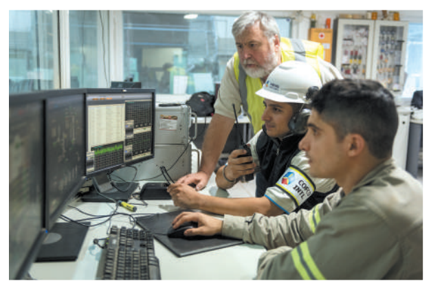
阿根廷提布斯港口是该国最重要的农产品出口枢纽之一，每年数百万吨的大豆、玉米、小麦和其他农产品从这里出发，被送往世界各地。中粮集团有限公司在这里建有码头及产业园。图为中粮集团员工在码头操作车间内工作。