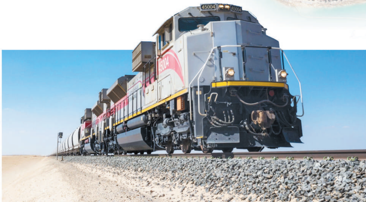
上图：伊提哈德铁路网是海湾铁路网络的重要组成部分，建成后将覆盖阿联酋主要工业中心、制造中心、物流中心、人口密集区和重要港口口岸。图为由中国建筑旗下中建中东公司联合承建的阿联酋伊提哈德铁路二期A标项目。