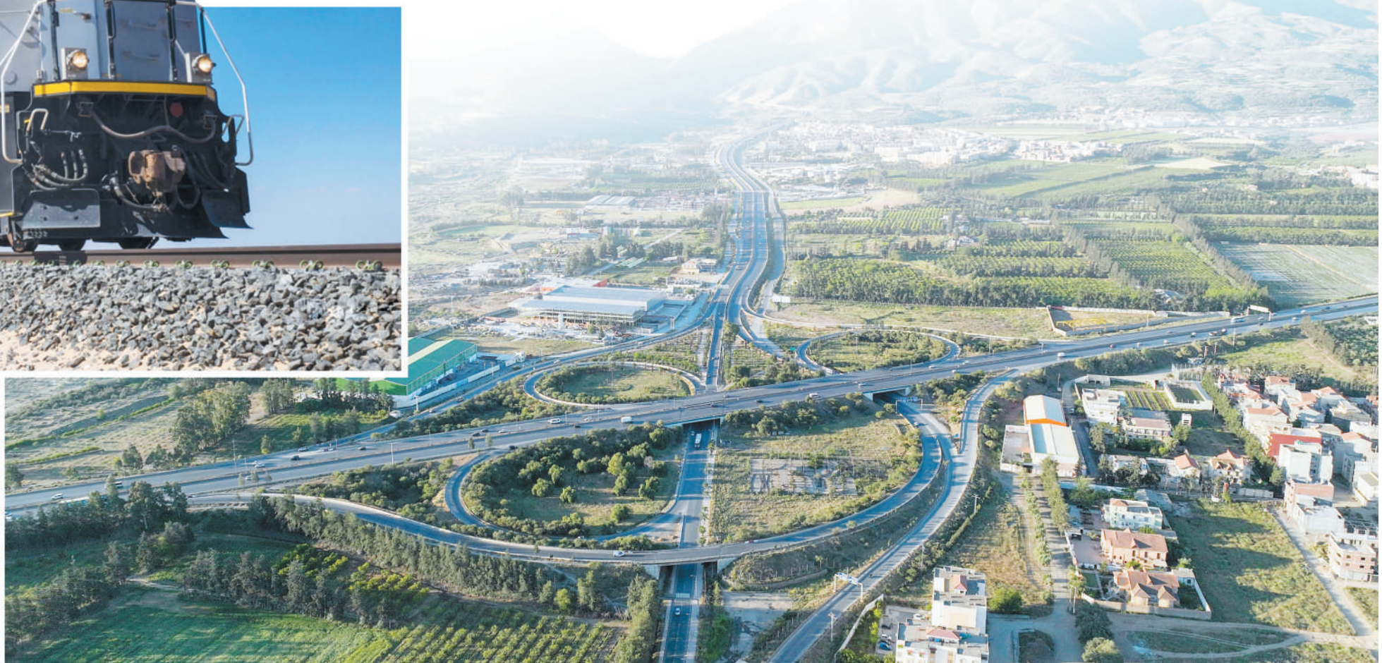
右图：阿尔及利亚南北高速公路纵贯该国全境，将撒哈拉沙漠与地中海沿岸连接起来。中国建筑承建的53公里项目穿过阿北部阿特拉斯山脉，是整个南北高速公路中施工和技术难度最大的一段。图为南北高速公路俯瞰。