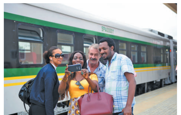
由中国土木承建的尼日利亚阿卡铁路连接尼日利亚首都阿布贾和北部工业重镇卡杜纳，正线全长186.5公里。该铁路的投入运营极大地便利了当地人员和货物的交流往来，促进尼日利亚经济发展。图为乘客在列车前留影。