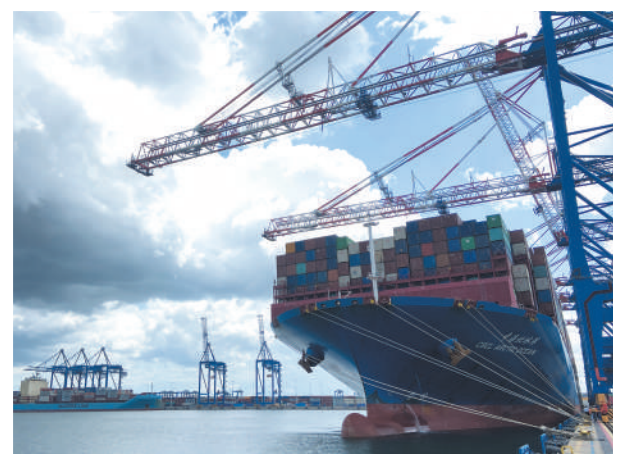
作为波罗的海最重要的港口之一，波兰格但斯克已经成为“一带一路”上陆运与海运的重要交汇点。图为停靠在格但斯克港的20万吨级集装箱巨轮“中海北冰洋”轮，该货轮主要负责亚洲与欧洲间的海上运输。