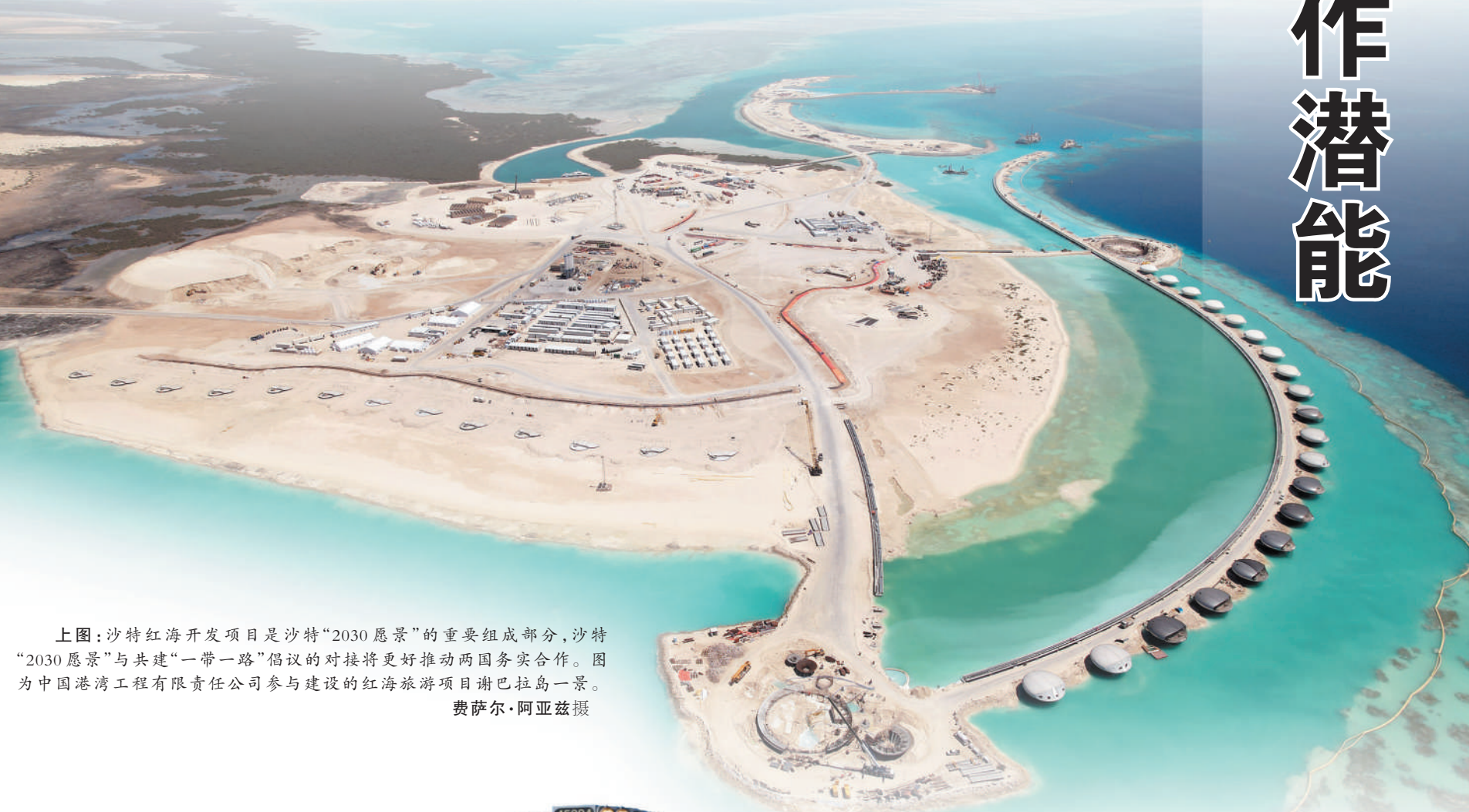
上图：沙特红海开发项目是沙特“2030愿景”的重要组成部分，沙特“2030愿景”与共建“一带一路”倡议的对接将更好推动两国务实合作。图为中国港务工程有限责任公司参与建设的红海旅游项目谢巴拉岛一景。

共建“一带一路”倡议提出10年来，中国携手共建国家和地区，致力于推动全球互联互通，充分释放沿线国家和地区各领域合作潜能，助力共同发展，增进共建国家和地区人民的福祉。10年来，从理念到行动，从愿景到现实，高质量共建“一带一路”不仅为中国开放发展开辟了新天地，更为各国共同发展开拓出一条机遇之路。